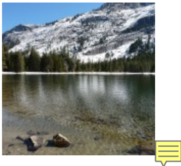
Tioga Lake Yosemite

Yosemiteký národní park je poměrně dobře v různých průvodcích a wikinách, takže se zaměřím spíše na to, co mne zaujalo.